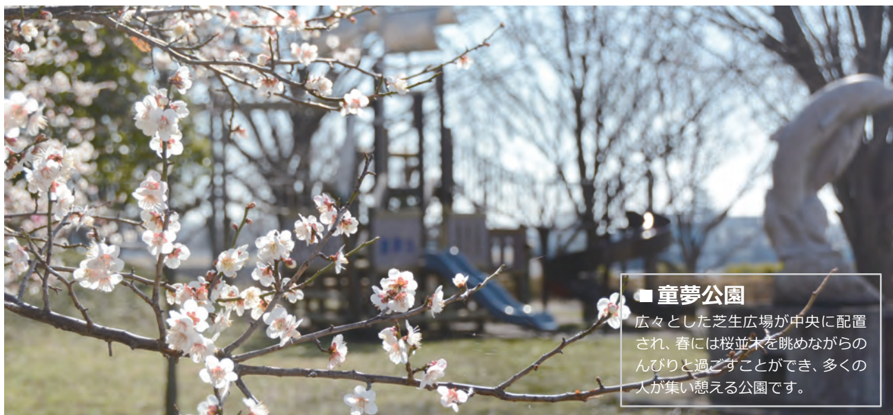
■ 童夢公園 広々とした芝生広場が中央に配置され、春には桜並木を眺めながらのんびりと過ごすことができ、多くの人が集い憩える公園です。