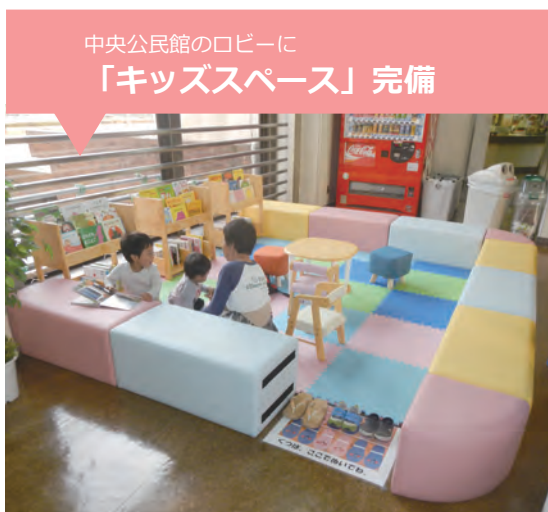
中央公民館のロビーに「キッズスペース」完備

妊産婦の方や0歳から高校生等（18歳に達した日以降の最初の3月31日までのお子さん）までが、病院や薬局などにかかったときに支払った、医療費の全部又は一部を助成します（保険適用外は助成されません）。