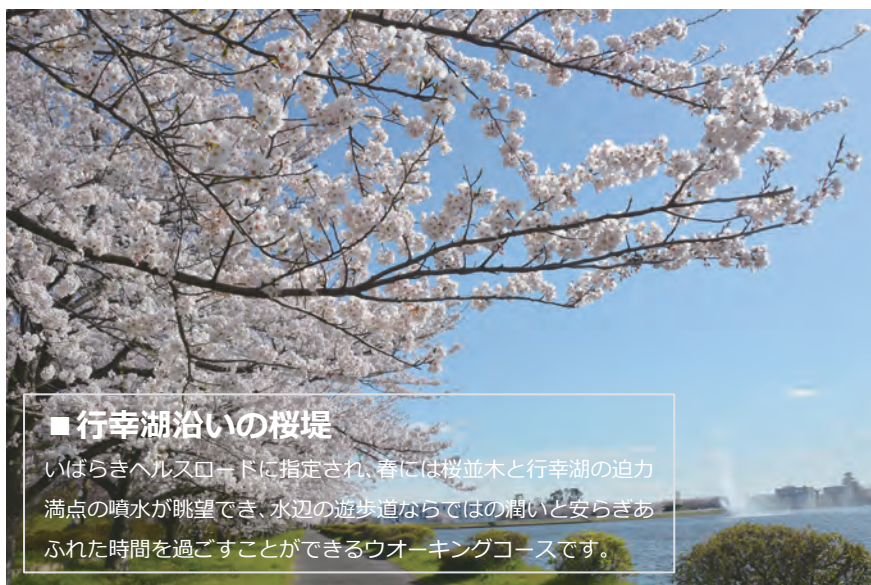
■ 行幸湖沿いの桜堤 いばらきヘルスロードに指定され、春には桜並木と行幸湖の迫力満点の噴水が眺望でき、水辺の遊歩道ならではの潤いと安らぎあふれた時間を過ごすことができるウォーキングコースです。

春は桜堤でお散歩、夏は利根川流域の「ハクレンジャンプ」と町内に青々と広がる田園風景、秋には黄金色の稲穂が頭を垂れ、冬は空気の澄んだ青空が見渡せます。町内の公園やサイクリングロード・ウォーキングコースでは、河川に囲まれたまちならではの四季折々の自然に触れ合うことができます。