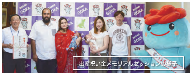
出産祝い金メモリアルセッションの様子