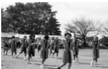
3、4年生による「よさこい『よつちよれ』」