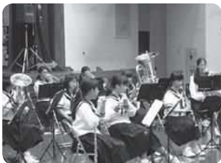
五霞中学校吹奏楽部による演奏