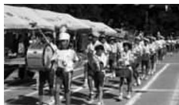
4、5、6年生による「西小鼓笛パレード」

「西小鼓笛パレード」です。本校では4、5、6年生で行いました。6年生にとつては小学校最後の運動会です。6年生を中心に鼓笛の練習を毎日続けてきました。高く澄んだ秋の青空の下、80名が心を一つにして、精一杯の演技を披露してくれました。