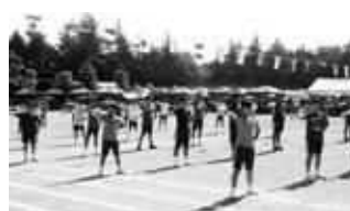
5、6年生による「そして未来へ」

力強く、激しく踊る振り付けのダンスがとても人気で、「来年もう一度踊ってみたいな。」と話していました。