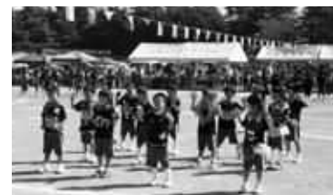
1、2年生による「ハロウィンパーティー」

力強く、激しく踊る振り付けのダンスがとても人気で、「来年もう一度踊ってみたいな。」と話していました。