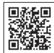
五霞町PR映像 QRコード