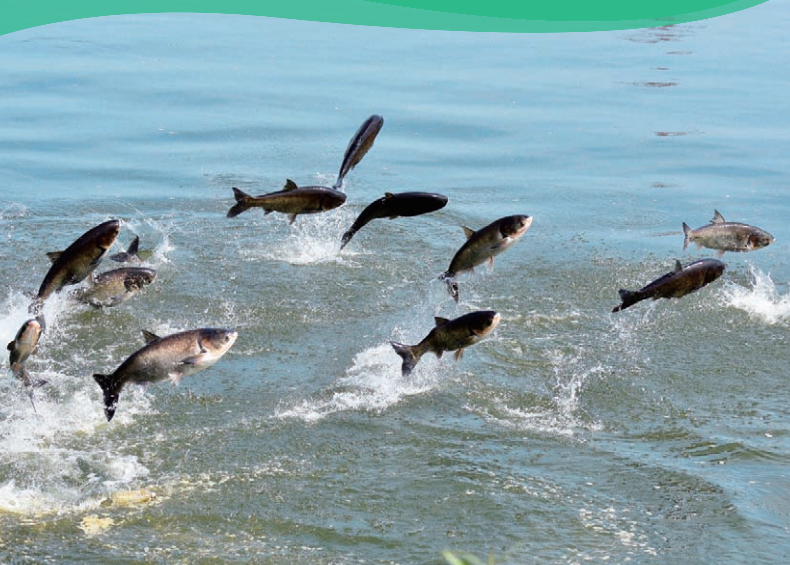
ハクレンの大ジャンプ(川妻地先)