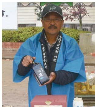
ふれあい祭り会場でのPR