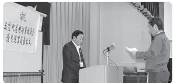
決意表明の様子(五霞ふれあいセンター)