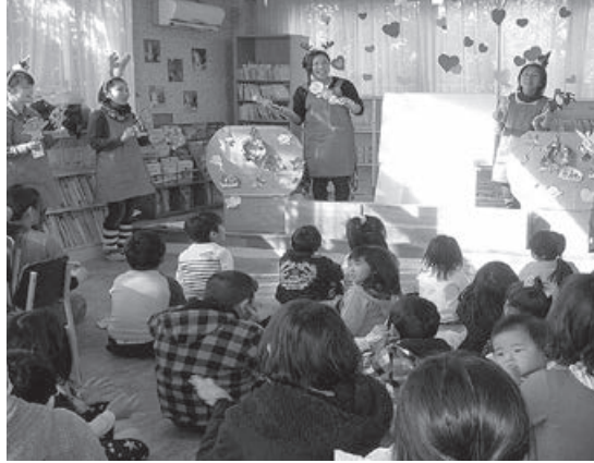
昨年度のフェスタの様子

12月の行事予定 ●西児童館 ☎84-2321 4日(金) ちびっこ広場 6日(日) 子育て応援フェスタ 10日(木) 手作りクッキング 14日(月) クリスマス工作 18日(金) ちびっこ広場 22日(火) 避難訓練 24日(木) クリスマス会