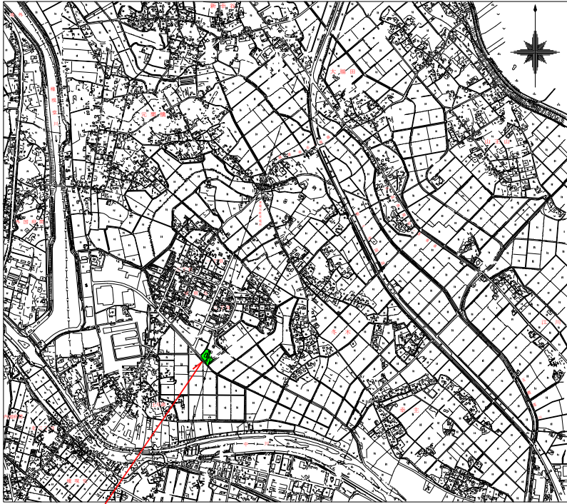
五霞町環境浄化センター