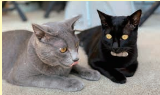
グレー猫のあずきと、黒猫のまめはきょうだいです。 2匹が来てから我が家に笑顔が増えました！