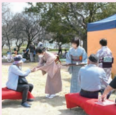
お茶のおもてなし