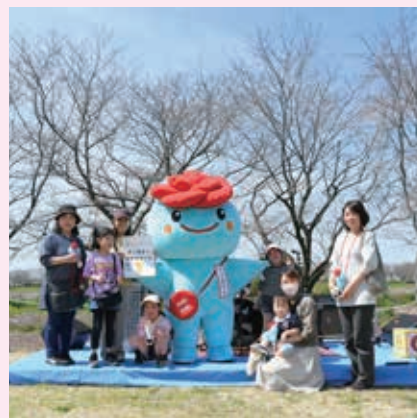
景品ねらって 「ごかりんじゃんけんポン」♪