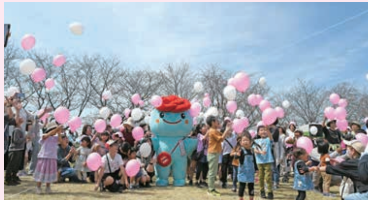
バルーンに願いをこめて