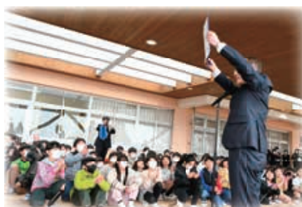
知久町長が児童に向けて開校宣言をしました