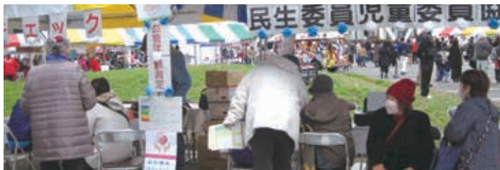
ふれあい祭り・健康福祉まつりにて啓発活動を行いました