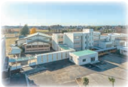
中学校校舎および武道場と渡り廊下でつながりました