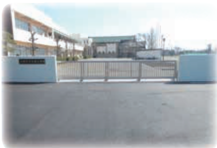
校門や教室もきれいになりました