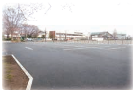
駐車場もきれいに整備されました