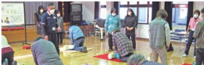
定例会にて保健や福祉に関する研修を行っています