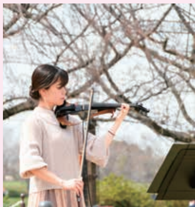
美しいバイオリンの音色に～