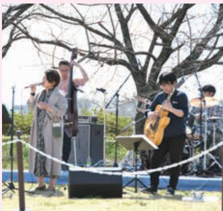
ジャズの雰囲気にとっとり