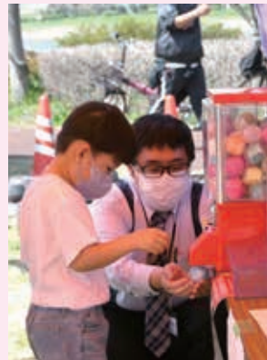
ガチャで何がでるかな？