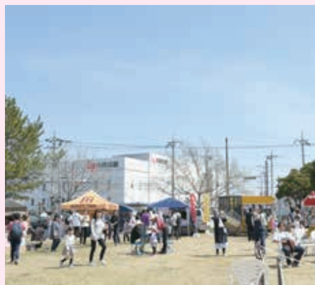
外で食べるのはおいしいね