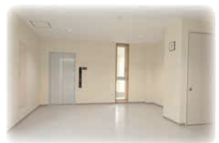
エレベーターが設置され バリアフリー化されました