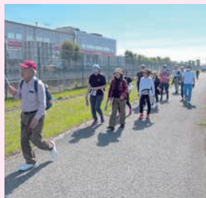
お花見ウォークも開催されました

○お問い合わせ 五霞イベント運営委員会事務局 (まちづくり戦略課) ☎(84)1111(内線212)