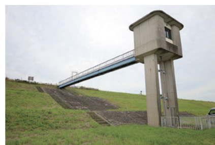
川妻揚水樋管 ひかん