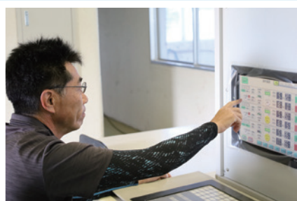
ポンプ操作の様子