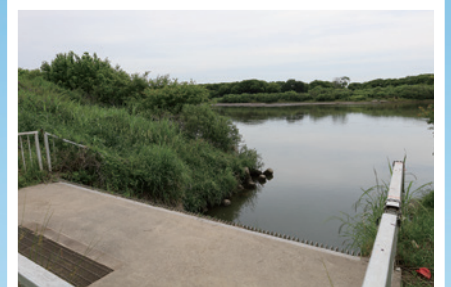
利根川からの取水口