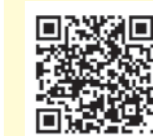
五霞町洪水 ハザードマップ