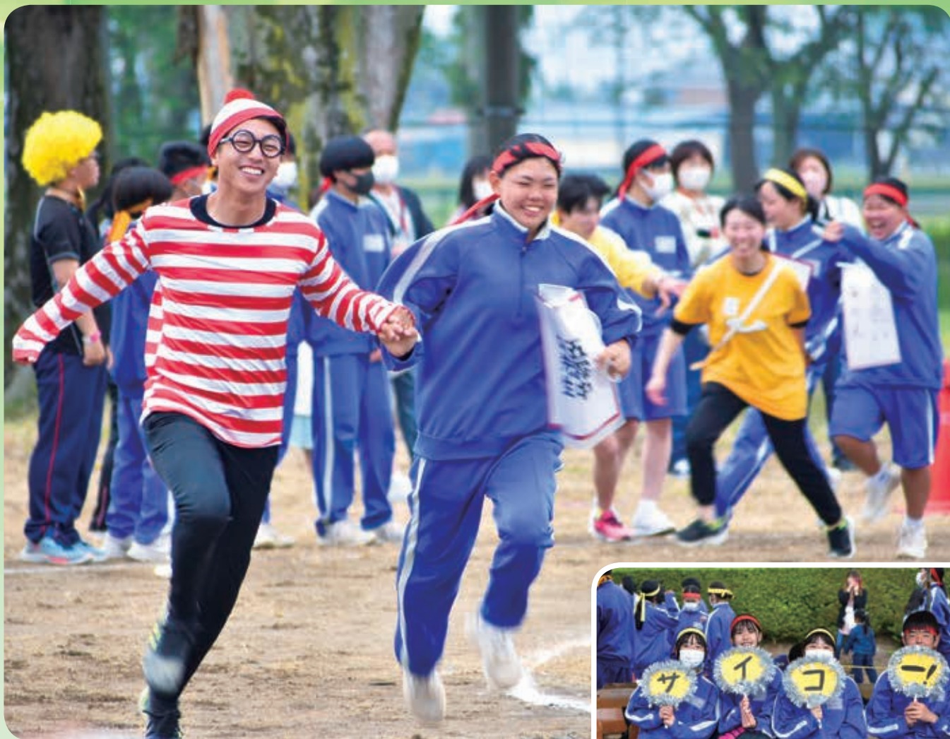
五霞中学校体育祭