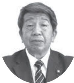
樋下 周一郎 議長