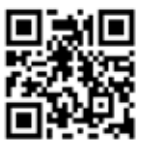
道の駅ごか案内ページ

五霞インターチェンジを降りて約1分、新4号国道沿いにある道の駅ごか。年間来場者数が約70万人を超える、人気の施設です。五霞町産の野菜や米、果物、加工品が購入できる農産物直売所「わだいの万菜」、地産産食材を使用したメニューが味わえるレストラン、フードコーナーなどがあります。