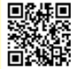
ごかりんクラブ案内ページ

グルメやおすすめスポット、イベント情報、さらに災害・緊急情報など、町の情報を発信しているスマートフォン用アプリ。町内だけでなく、興味がある人なら誰でも登録可能。アンケートや投稿でポイントを貯めると、特産品が当たるプレゼントに応募できます。