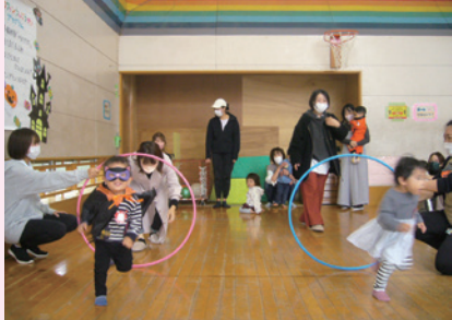
西児童館「ちびっこ広場」の様子