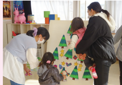
南児童館「にこにこ広場」の様子