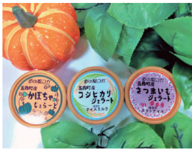
道の駅ごかを拠点とした 地域活性化事業