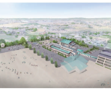
ごっか子を育てる 新しい学校環境整備事業