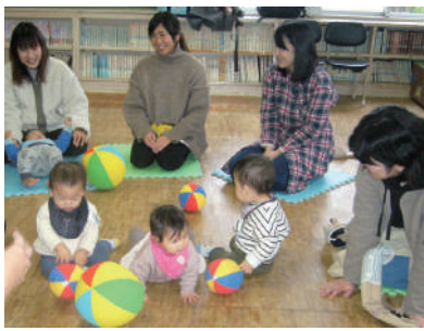
子育て世代包括支援センター事業