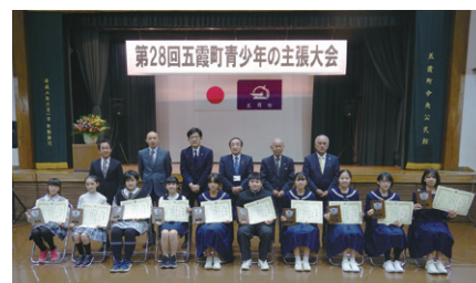
代表者の主張をオンラインで視聴様子