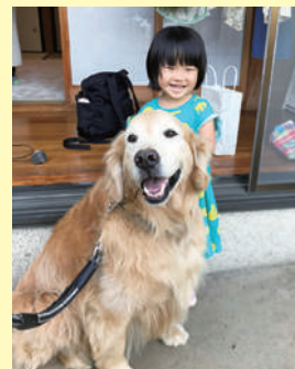
一緒に大きくなろうね。