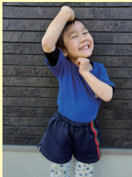
イタズラ大好きな煌ちゃん！我が家のムードメーカー！