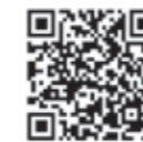
五霞町洪水ハザードマップ

ハザードマップで自宅の災害リスクを確認しよう ハザードマップとは、浸水や土砂災害の危険がある地域や災害発生時の避難先(指定避難所など)が示された地図のことで、市町村ごとに作成されています。 五霞町の浸水想定区域を確認できる洪水ハザードマップは、町公式ホームページや国土院の「わがまちハザードマップ」に掲載されています。自宅がある場所に色で塗られていたら、災害が発生する可能性がありますので、避難するタイミングを確認の上、マイ・タイムラインを作成しましょう。