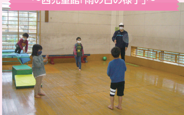
～西児童館「雨の日の様子」～

児童館では雨の日でも元気いっぱいの子どもの声が響いています。一輪車に乗る子、トランポリンやドッジボールをする子、静かに読書を楽しむ子もいます。入学したばかりの一年生も、他学年の子に混ざってボール遊びをする姿が見られました。低学年のお友だちが「いーれー」とお兄さんお姉さんに勇気を出して声を掛けると、「いーよー」と快く仲間に入れてくれて大人気で遊んだり…。そんな姿を見るとほっこりした気持ちになりますね。遊戯室では幼児のお友だちがおうちごっこや車に乗っておでかけです。雨でもとても賑やかな午後でした。