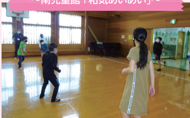
～南児童館「和気あいあい」～

人気ナンバー1のドッジボールは、低学年と高学年に分けて行います。高学年の試合には低学年も参加できます。 6年生のボールの速さに驚きながらも、負けずに投げ返し白熱した試合です。試合中はボールを独占するのではなく、低学年に譲りながら遊んでくれたことに、やさしさを感じました。 4月から5月上旬、館内には鯉のぼりが飾られています。大空を悠々と泳ぐ鯉のぼりのように元気にたくましくなあれ。