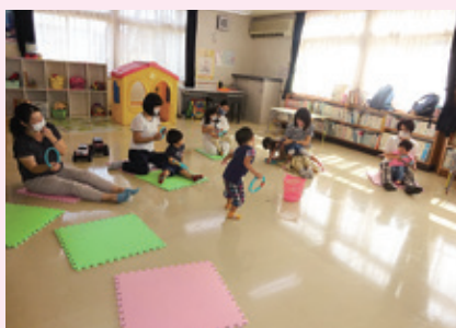
南児童館「にこにこ広場」の様子