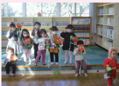
西児童館「ちびっこ広場」の様子