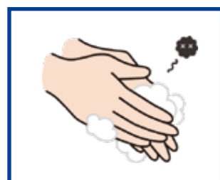
来場前の手洗い・うがい