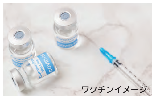
ワクチンイメージ