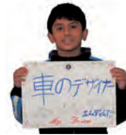
エムディムアジさん