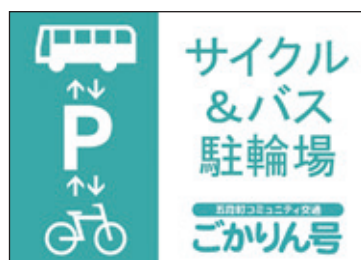
【こちらの看板が目印となります】