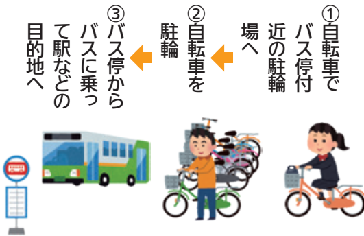
【サイクル&バスライドのイメージ】

通勤・通学や買い物など様々な日常の移動手段として、ごかりん号を利用される際、駐輪場をご利用ください。