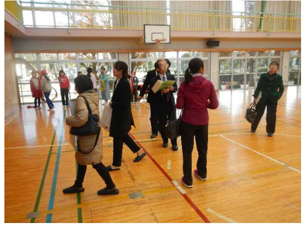
(五霞町立五霞西小学校)