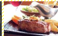
ステーキハウス赤坂