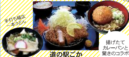
道の駅ごか (レストラン華ごぶし)