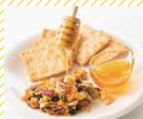
田舎はちみつ あかぼっけ