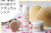
「Su Mi Tsu」Comb Honey Cosmetics <基礎化粧品>