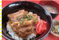
ごはんのお店 彩花