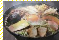
ばんどう太郎 五霞店