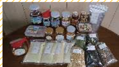
ハチミツマーチャン