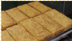
玉木の厚焼き玉子