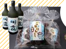
道の駅ごか (茨城物産品販売所)