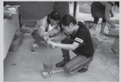
H30.9.15「児童館の火」 母親クラブ協力によりおこし(西児童館)