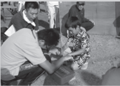
H30.7.15「元栗橋の火」 八坂神社夏祭りでおこし(元栗橋)

6月9日には、7つの集火された火を持ち、町内全行政区を駆け巡った五霞町炬火リレーが開催され、「ごかから灯せ つながれ未来へ 絆の火」が誕生し、9月28日の茨城国体総合開会式まで火を灯し続けました。 火おこしに協力いただきました皆様、ありがとうございます。