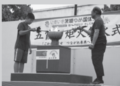
R1.6.9「ごかから灯せ つながれ未来へ 絆の火」 五霞町の炬火誕生の瞬間