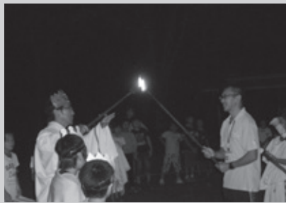
H30.9.6「東西小学校友情と団結の火」 キャンプファイヤーでおこし(東・西小学校)