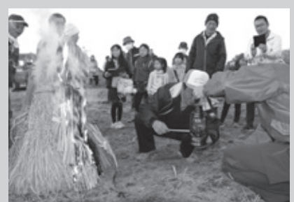
H31.1.13「元栗橋新田地区かがり火の火」 かがり火のやぐらから火おこし(元栗橋)