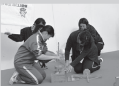
H30.11.4「ふれあいの火」 五霞ふれあい祭りで火おこし