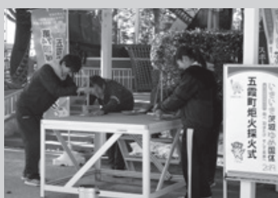
H30.12.14「もちつきの火」 もちつき会で火おこし(五霞幼稚園・保育園)