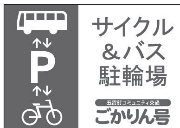
【こちらの看板が目印となります】