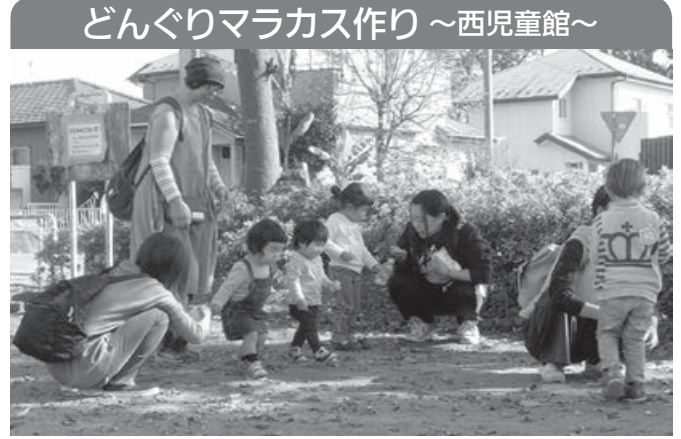
どんぐりマラカス作り ~西児童館~

11月9日、南児童館では「にこにこ広場」の通常活動の後、交通安全教室を実施しました。 初めに、保護者向けの「命の大切さ」や「ルールを守る」には、「子どもから目を離してはいけない」、保護者が「交通マナーの手本を示す」などの具体的にまとめたDVDを鑑賞後、実際にあった交通事故のお話や交通事故から子どもを守るために気を付けなければならぬことなど、大変参考になる内容のお話を母さん方も熱心に聞いていました。 交通安全母の会のみなさん、元栗橋・小福田駐在所のおまわりさんには、ご協力をいただきありがとうございました。