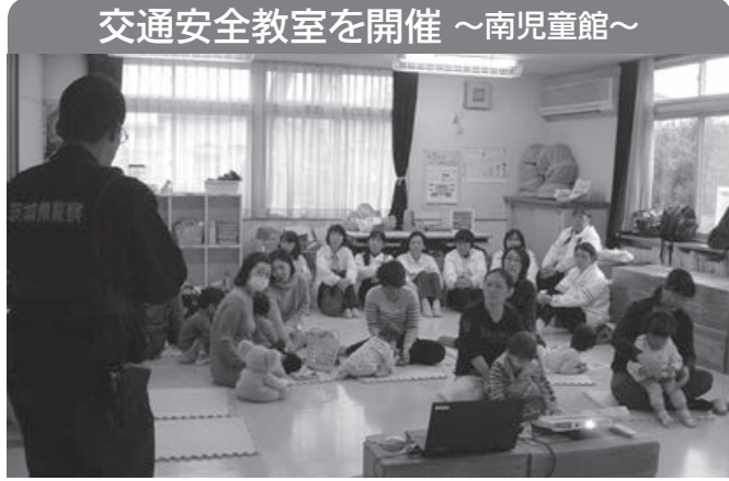
交通安全教室を開催 ~南児童館~

11月9日、南児童館では「にこにこ広場」の通常活動の後、交通安全教室を実施しました。 初めに、保護者向けの「命の大切さ」や「ルールを守る」には、「子どもから目を離してはいけない」、保護者が「交通マナーの手本を示す」などの具体的にまとめたDVDを鑑賞後、実際にあった交通事故のお話や交通事故から子どもを守るために気を付けなければならぬことなど、大変参考になる内容のお話を母さん方も熱心に聞いていました。 交通安全母の会のみなさん、元栗橋・小福田駐在所のおまわりさんには、ご協力をいただきありがとうございました。