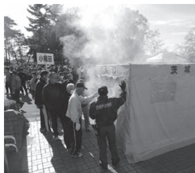
昨年の訓練の状況