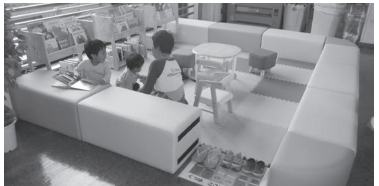
4月にオープンしたキッズスペース