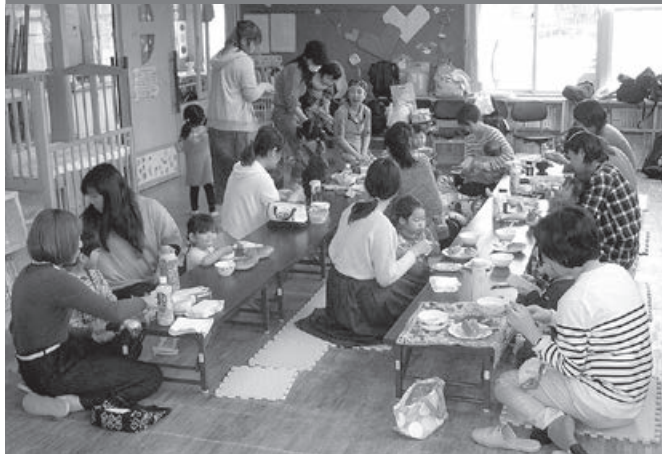
ちびっこ広場修了式 ~西児童館~

3月16日、西児童館において、「ちびっこ広場修了式」を行いました。 昨年4月21日の開級式は9組で始まりましたが、17組まで増えました。鳩ポッポ体操やエビカニクスを踊ったり、また、遊具を使った遊びなど動く活動をしました。この他、お誕生日会、季節の行事や親子での製作活動などをして、お友だちと一緒に楽しんで過ごしてきました。 終了式後の食事会では、野菜スープとホットドックをみんなでおいしくいただきました。 この広場では、子どもたちだけでなく、お母さんたちもお互いに交流ができる有意義な場があります。