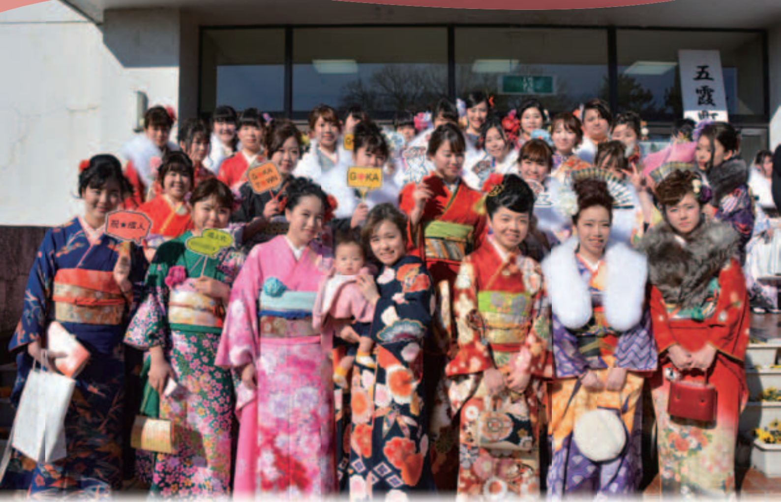
五霞町の未来を担う新成人