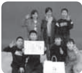
優勝の原宿台Aチーム