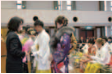
恩師への花束贈呈

1月7日、中央公民館講堂において「平成30年成人式」が行われ、新たに成人の仲間入りをした82名が出席されました。（該当者は93名）