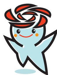
五霞町イメージキャラクター 「ごかりん」