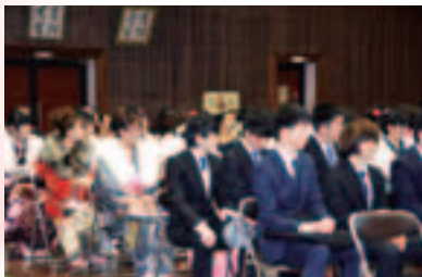
式典に参加した新成人