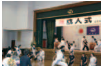
茨城三宅会の演奏