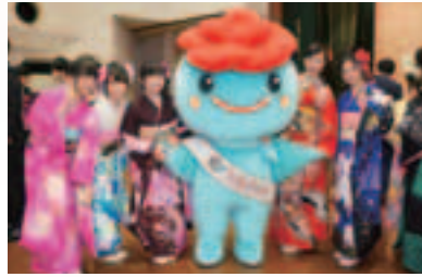
ごかりんと記念撮影