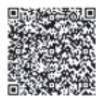
携帯用 応募フォーム

町公式ホームページ応募フォームから(パソコン・携帯可) http://www.town.gokai.jp/ または、次のQRコードを読み込み応募フォームからお申し込みください。