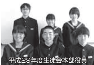
平成29年度生徒会本部役員

私は、五霞中生が未来に自主的に前進できるような学校にしたいと考えています。「STEP TO THE FUTURE」これは今年の生徒会スローガンです。未来へ進む五霞中生になるためには、一人一人の目標があることが必要だと思います。生徒会は、その目標達成の中心として活動し、よりよい五霞中学校を築いていきます。