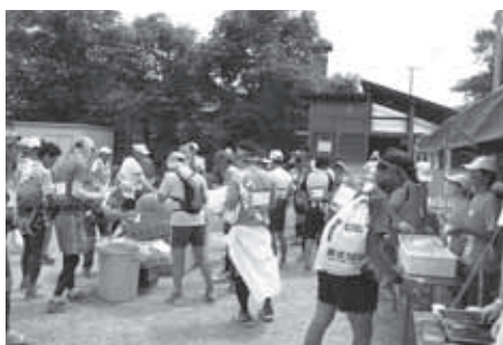
昨年の様子(五霞町レストステーション)