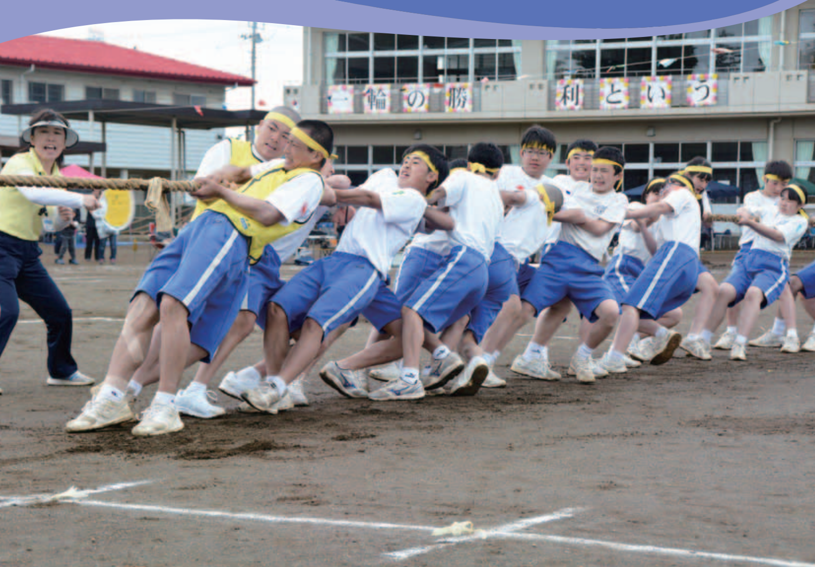
五霞中学校体育祭