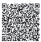
スマートフォン用 応募フォーム