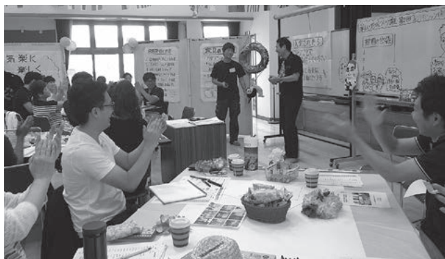
楽しい地域づくり講座