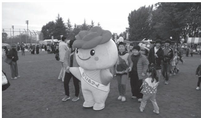
五霞ふれあい祭り