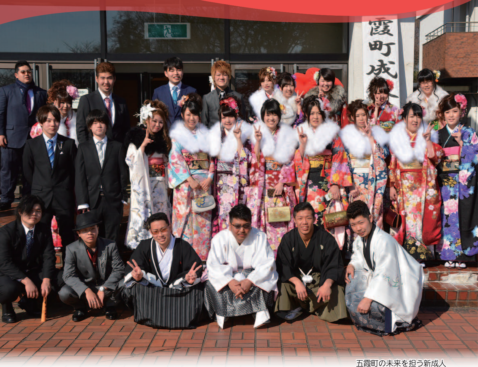
五霞町の未来を担う新成人 (関連記事16ページ)