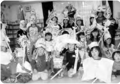
▶「ハロウィン」の様子

南児童館では、10月29日に「ハロウィン」を行いました。新聞紙を使い、帽子を作りました。初めはどう作るのかと悩んでいた子も、いろいろ工夫をして、思い思いの素敵な帽子が出来上がりました。中には、ステッキや服まで作った子もいました。最後に、児童館特製のかぼちゃのかりんとうを、みんなで食べました。