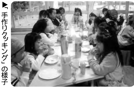
▶「手作りクッキング」の様子

西児童館では、11月22日に「手作りクッキング」を行いました。思い思いの形のハンバークを作り、レタスと一緒にパンにはさんでハンバーガーの出来上がりです。フライドポテトも添えて、まるでバーガーショップにでも行った気分です。美味しい、美味しい」と言いながら口いっばいにほお張って味わっていました。児童館では、みんなと一緒に作る楽しさを感じてほし