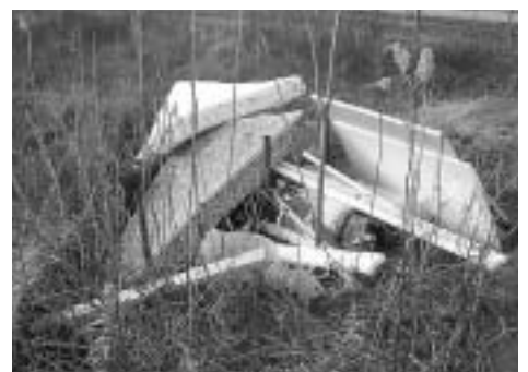
不法投棄されたごみ

【不法投棄をなくすには】 町では、不法投棄が多発する 場所を重点的にパトロールし、 不法投棄の防止に努めてしまし たが、残念ながら解決には至っ ておりません。