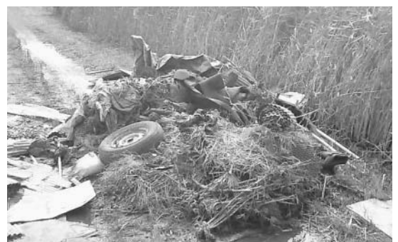
不法投棄されたごみ