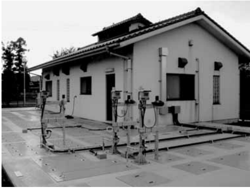
大福田水処理センター