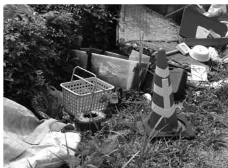
不法投棄されたごみ