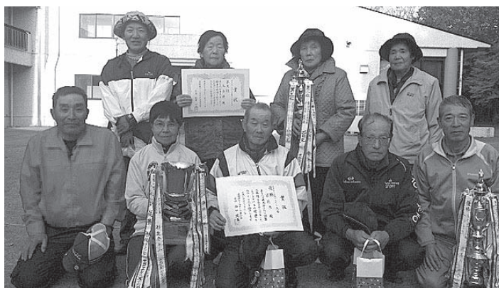
宮前Bチーム(前列)、土与部チーム(後列)

ゲートボール連合会は、会員を随時募集しております。みなさんも一緒にゲートボールを楽しみましょう。