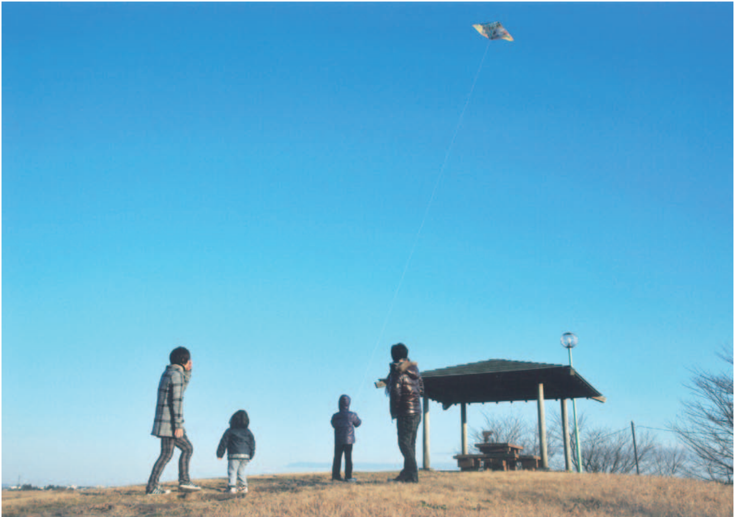
スーパー堤防上で凧揚げを楽しむ家族