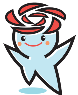
五霞町イメージキャラクター 「ごかりん」