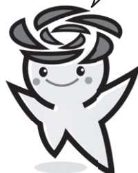
五霞町イメージキャラクター『ごかりん』