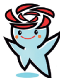
五霞町イメージキャラクター 「ごかりん」