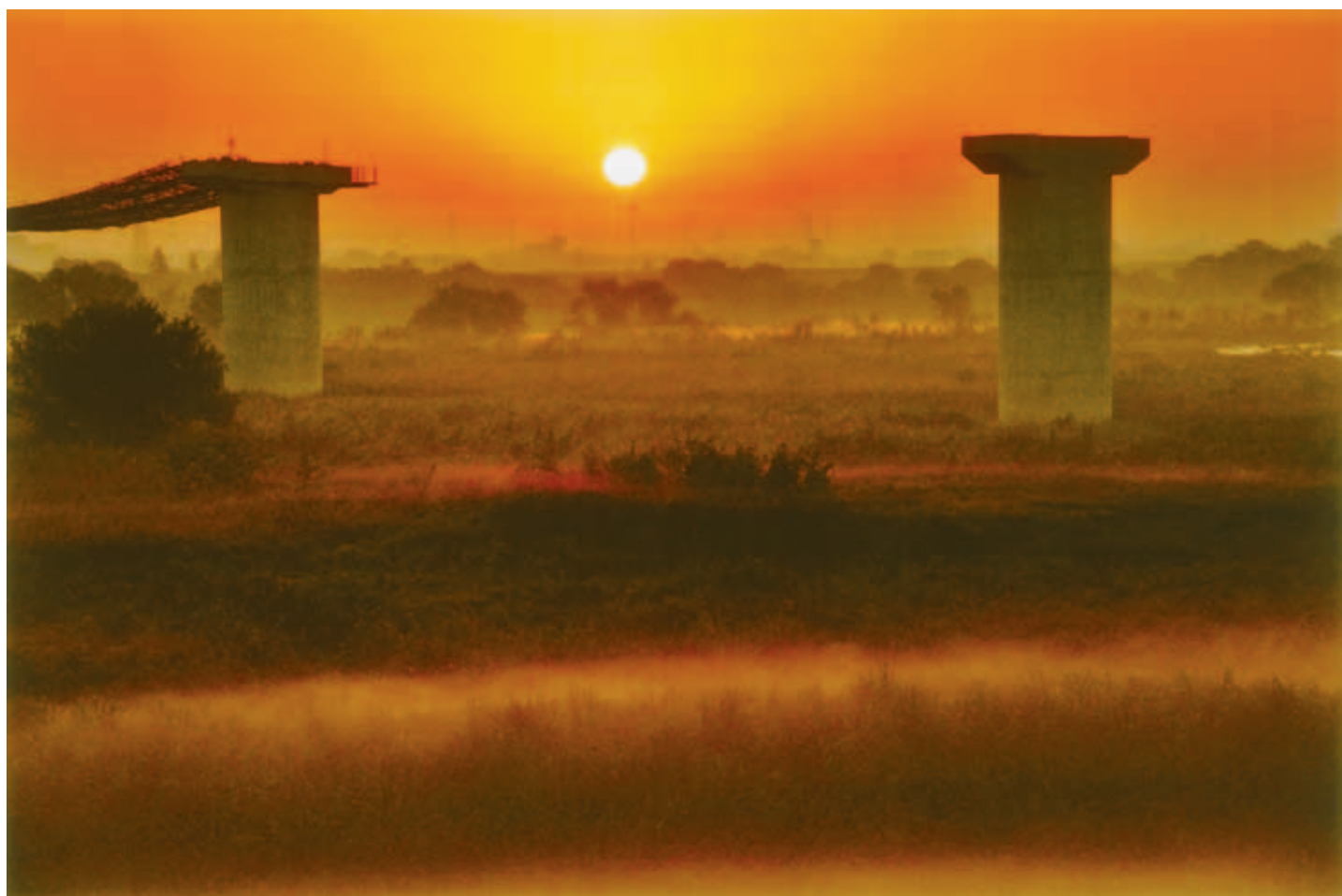
五霞町大福田地内から望む朝日