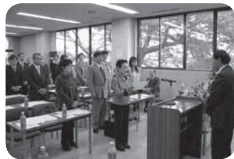
表彰式の様子（中央公民館にて）