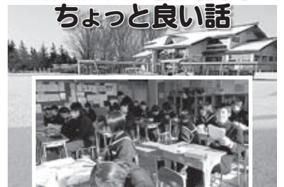
雪の降り積もった校庭(あるクラスの授業風景)

ほんの少しの気遣いで周りのみんなが気持ちよく生活できるという場面がたくさんあります。先日もこんなことがありました。毎朝、感染症予防のために昇降口で手指の消毒を行っています。シュッシュとスプレーをしたところ、「ありがとうございます」という返事を返してくれる生徒がたくさんいました。