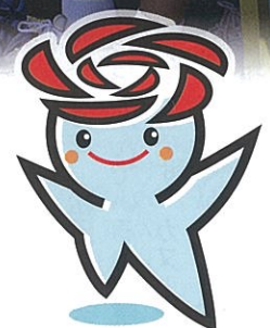
五霞町イメージキャラクター 「ごかりん」