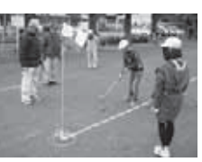
グラウンドゴルフの1コマ

11月には、5年生が五霞町シニアクラブの方々とグラウンドゴルフでの交流会を行いました。児童たちは、初めての体験だったので慣れるまで少し戸惑っていましたが、シニアクラブの方々が優しく丁寧に教えてくださいました。徐々にこつを掴み、グラウンドゴルフを楽しみました。交流を通して優しさや思いやりの心が育ちました。