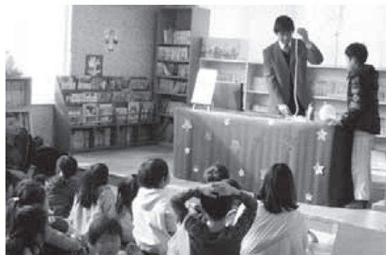
[昨年度の子育て応援フェスタの様子]