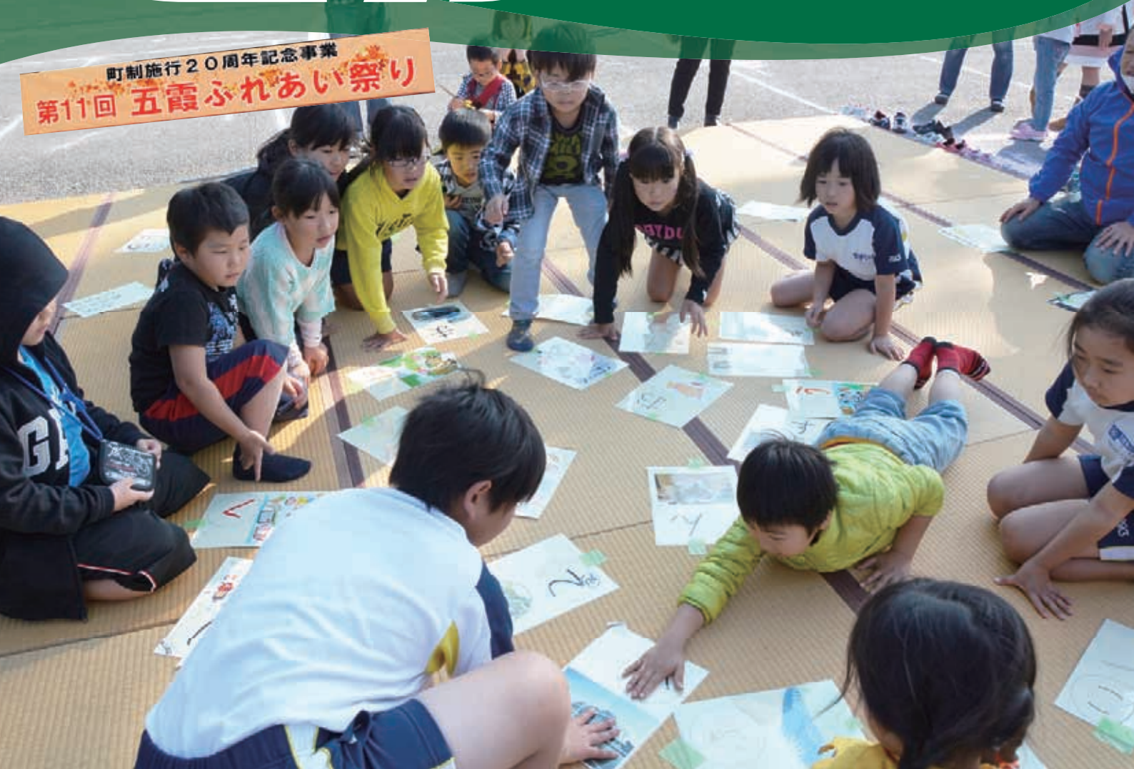
第11回五霞ふれあい祭り (キングオブごかるた2016の様子)