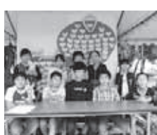
健康福祉まつり なかよしの木 成しました。また、ゲームを通して地域の方々と交流を深めました。

また、体育館の通路南側を「にしびよん通り」と命名しました。今はコスモスが、秋風に吹かれながら可憐な花を咲かせています。