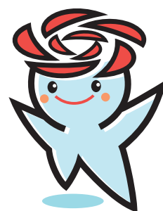
五霞町イメージキャラクター 「ごかりん」