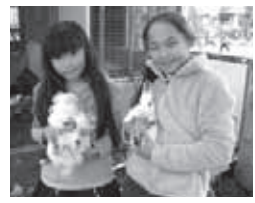
飼育委員 児童の活動

げたり、うさぎ小屋の掃除をしたりしています。春に生まれたうさぎの赤ちゃんは大きく育ち、元気に走り回っています。みんな、うさぎの姿を見ることが楽しみになっています。