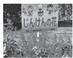
学年花壇のサルビア

五霞西小学校では、様々な行事を通して人権意識を高める活動を行っています。特に学校全体で草花を育てたり、生き物を育てたりすることで命の大切さや優しさ、思いやりの心を育てています。