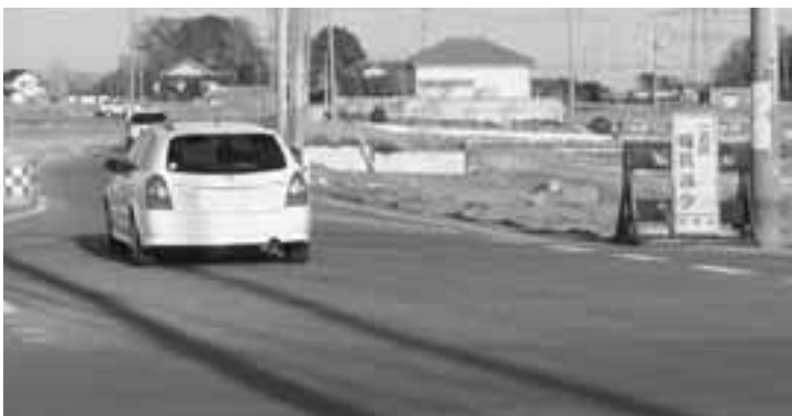
県道西関宿栗橋線新幸谷地内の完成と合わせて全線開通が望まれる町道9号線