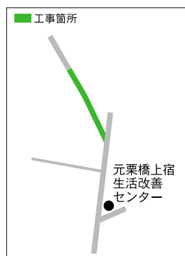
【町道2133号線道路舗装工事】